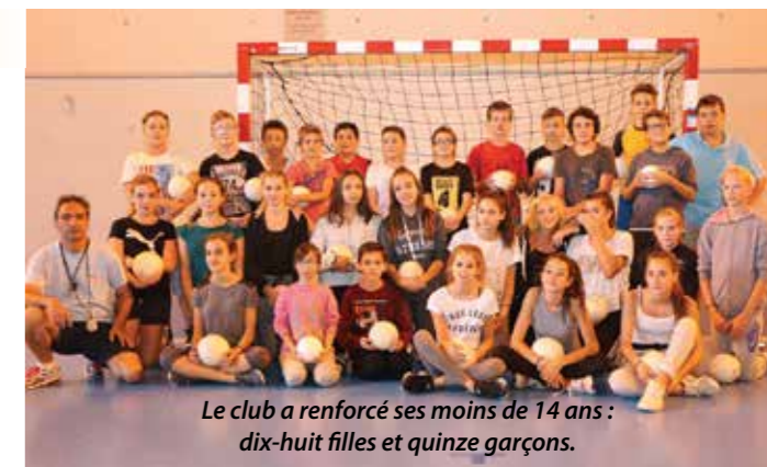
Le club a renforcé ses moins de 14 ans : dix-huit filles et quinze garçons.

Les moins de 12 ans, répartis sur deux équipes garçons et une équipe filles, se sont, quant à eux, rendus en car à Tallard le mercredi 23 novembre 2016 pour affronter celles de Serres, Laragne et Tallard.